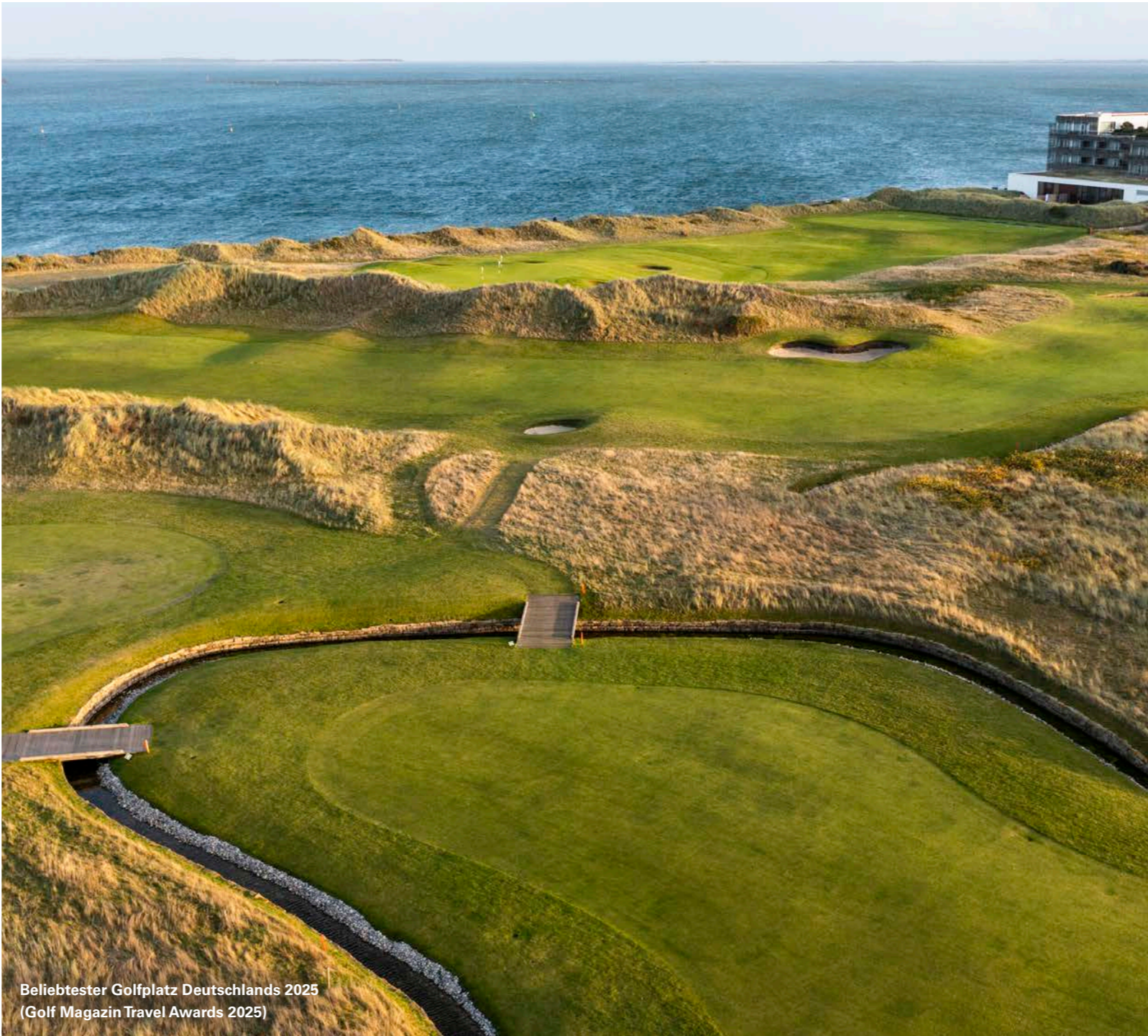
Beliebtester Golfplatz Deutschlands 2025 (Golf Magazin Travel Awards 2025)